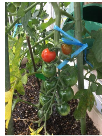
トマト収穫できました(^^)