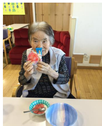
おやつレク「アラカルト」 どれにしようかな?