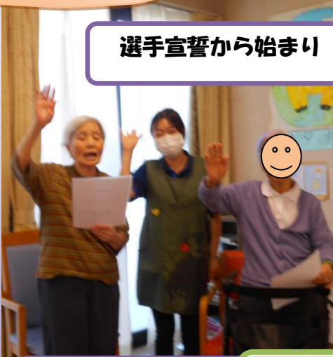
選手宣誓から始まり